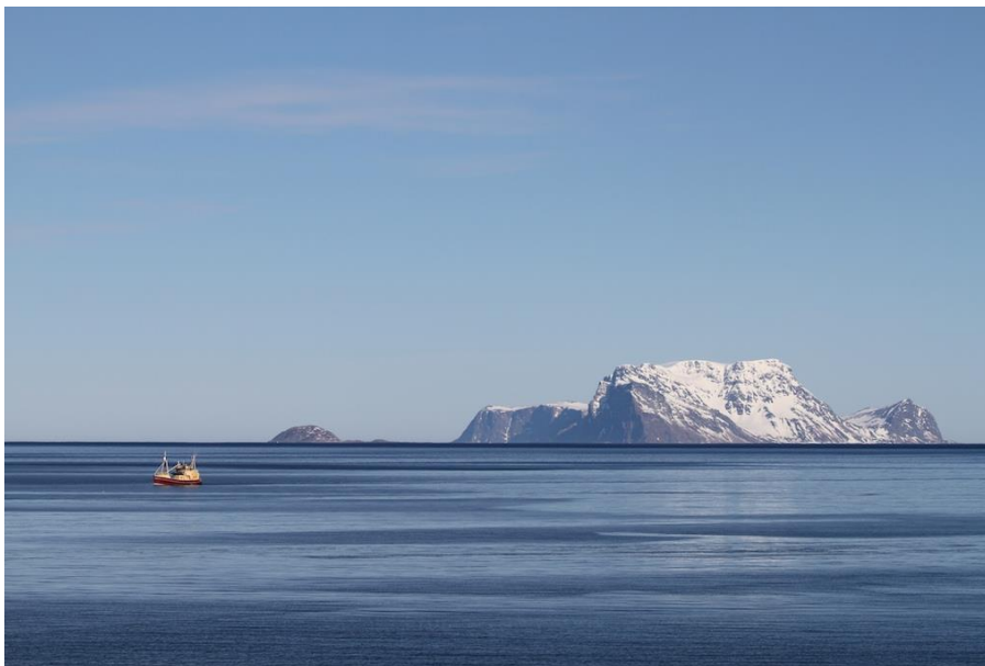
En otroligt fin dag där man knappt tror att vi korsat Barents hav. Det såg annorlunda ut när vi sglade norröver.....

Nord Fågelön är känd för sitt rika fågelliv där bland annat lunnefågeln bosätter sig