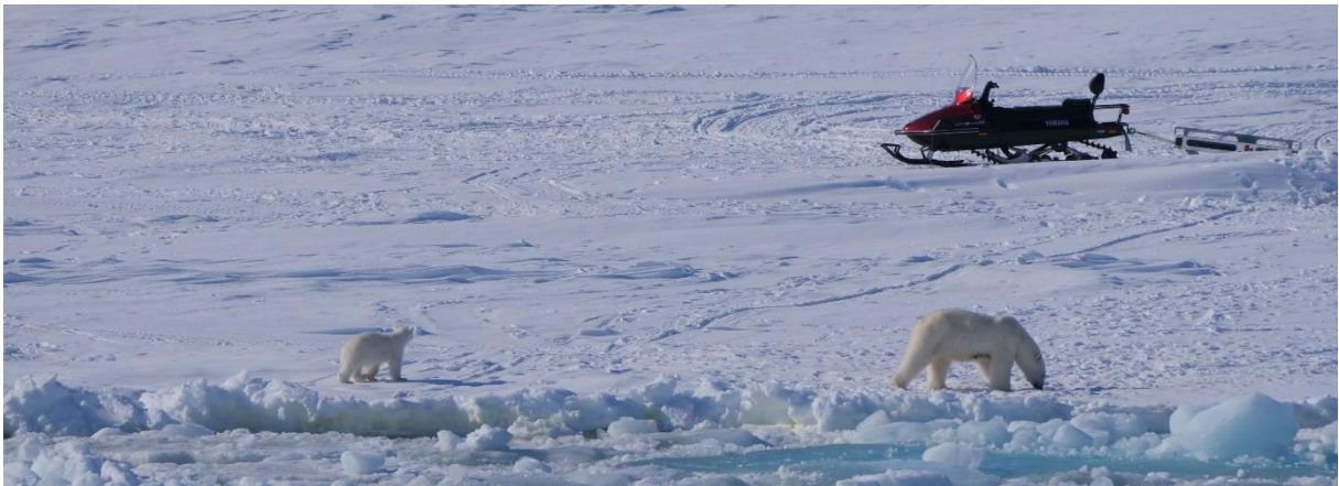
En annan mamma med unge