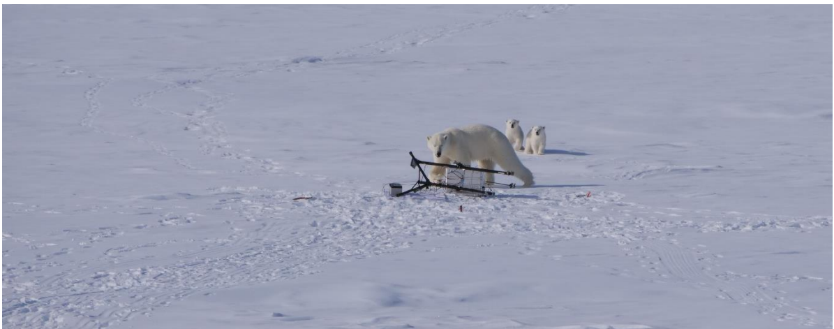
Nyfiken isbjörnsamma med sina årsungar inspekterar ett instrument som de tyckte skulle monteras på annat sätt. Detta instrument klarade den omilda behandlingen trots allt.