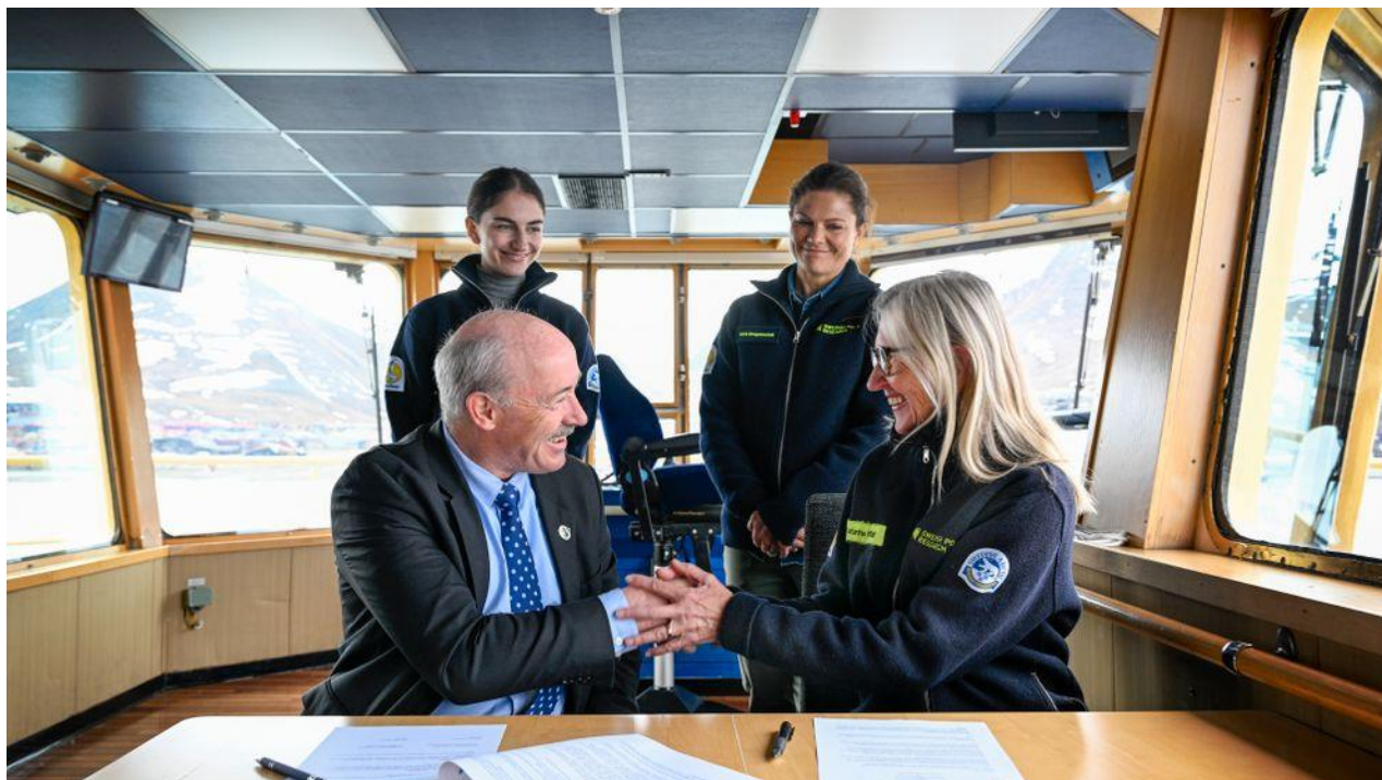
Undertecknande av samarbetsavtal mellan Sverige och Norge under översyn av Kronprinsessan Victoria.