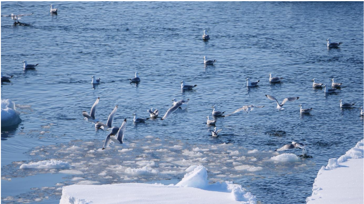
En flock nyfikna Tretåiga måsar som cirklade runt.