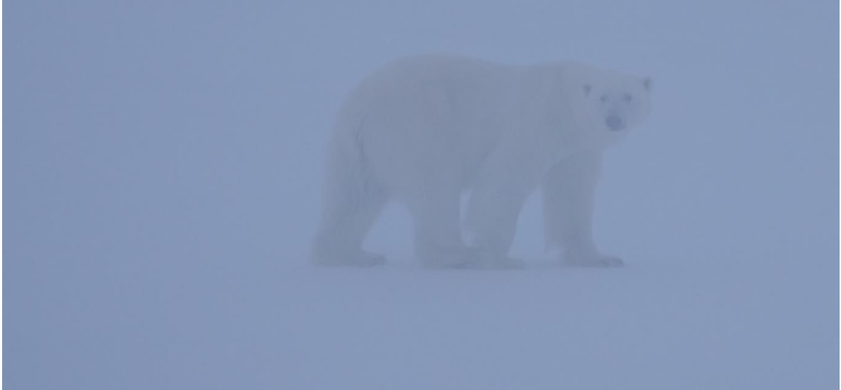
Vi måste vara vaksamma då de är ytterst skickligt kamouflerade i sin miljö.