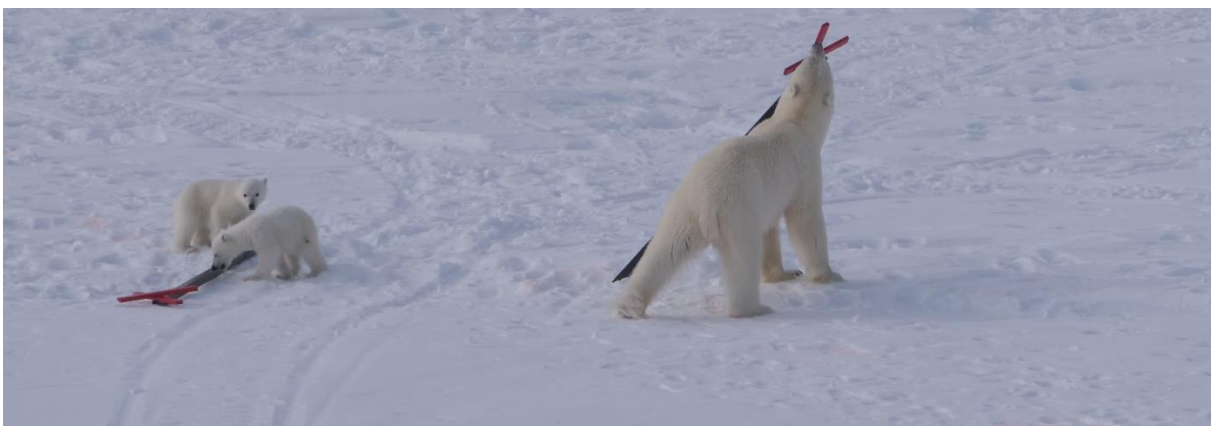
Sådan mor sådana barn.