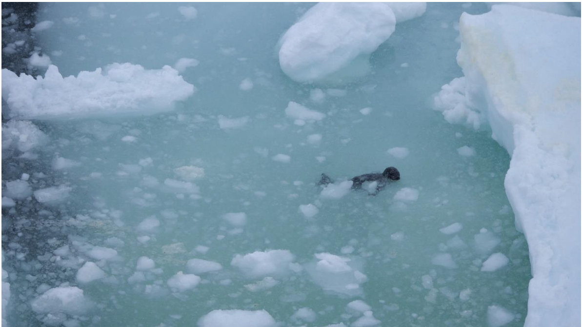
En liten Grönlandssällkut som isbjörnarna gärna hade satt tänderna i.