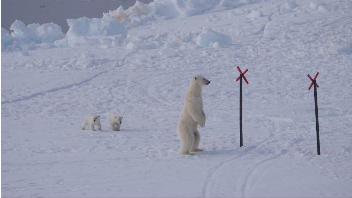
Våra siktpinnar som vi bedömer sikten med var tydligen extra intressanta