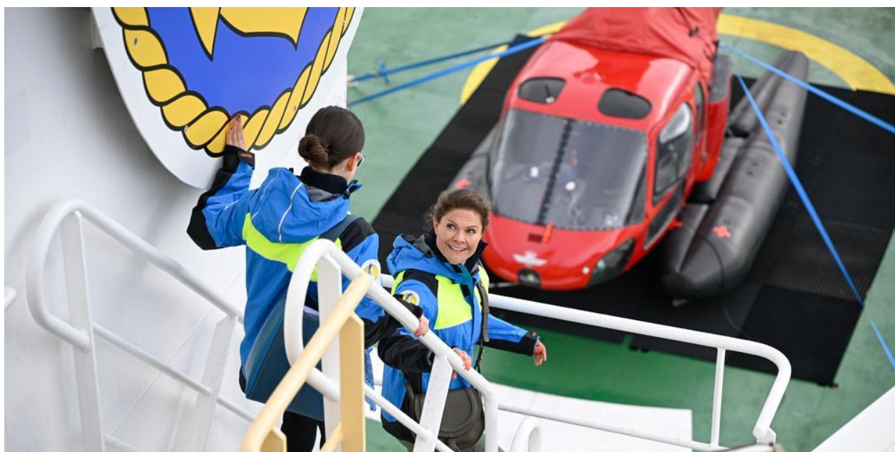
Kronprinsessan visar runt Miljö och klimatministern på Oden.