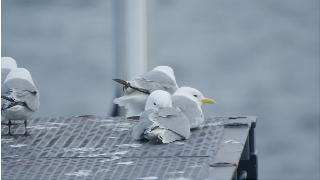
Fripassagerare från Svalbard till Nord Norge.

Ha det nu så bra, så hörs vi i under nästa expedition.