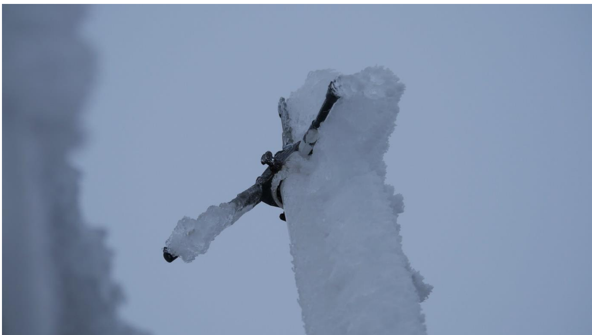
Radioantenn täckt med rimfrost och is.