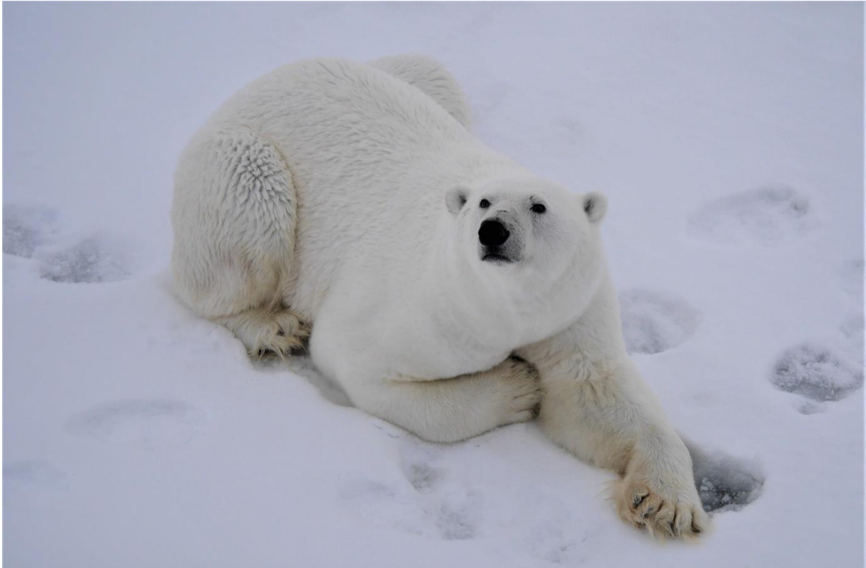
Ett riktigt charmtroll