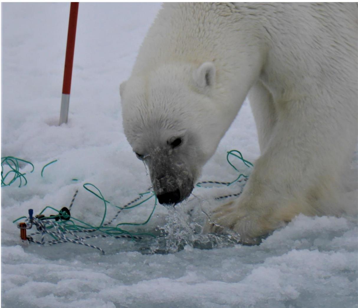
Lite nyfiken var den på den utrustning forskarna hade placerat ut på isen