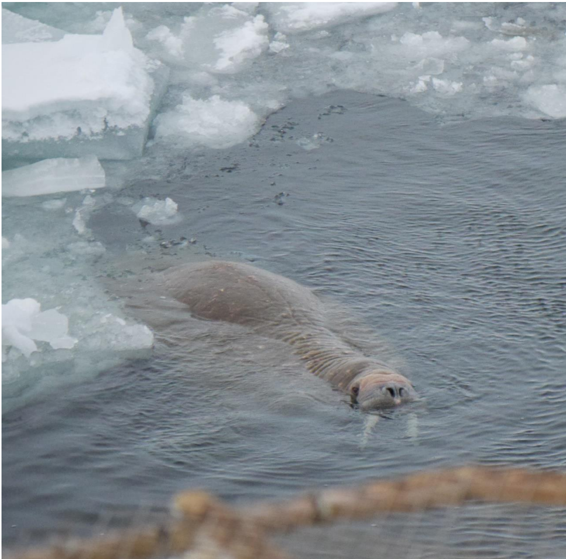
En nyfiken valross dök upp strax efter björnen