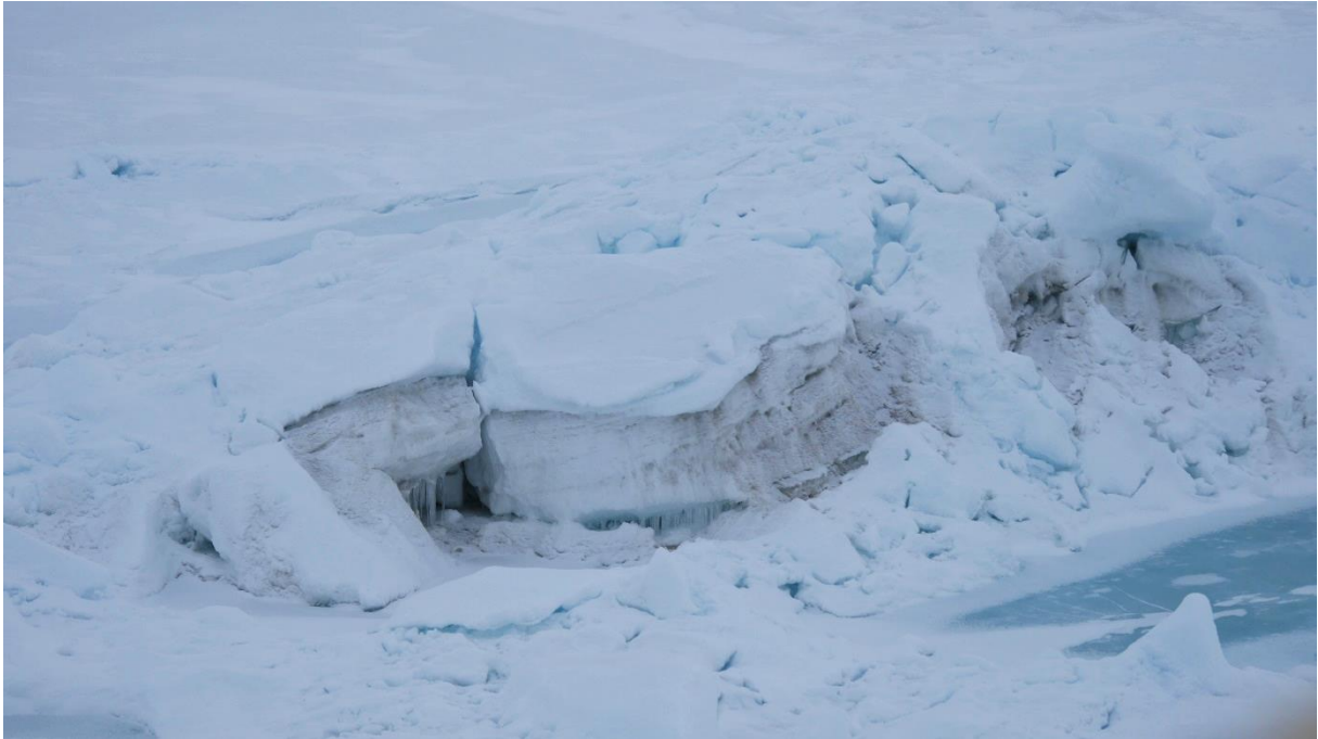
Här kan man se färgnyansen som skiljer flerårsis och yngre is.