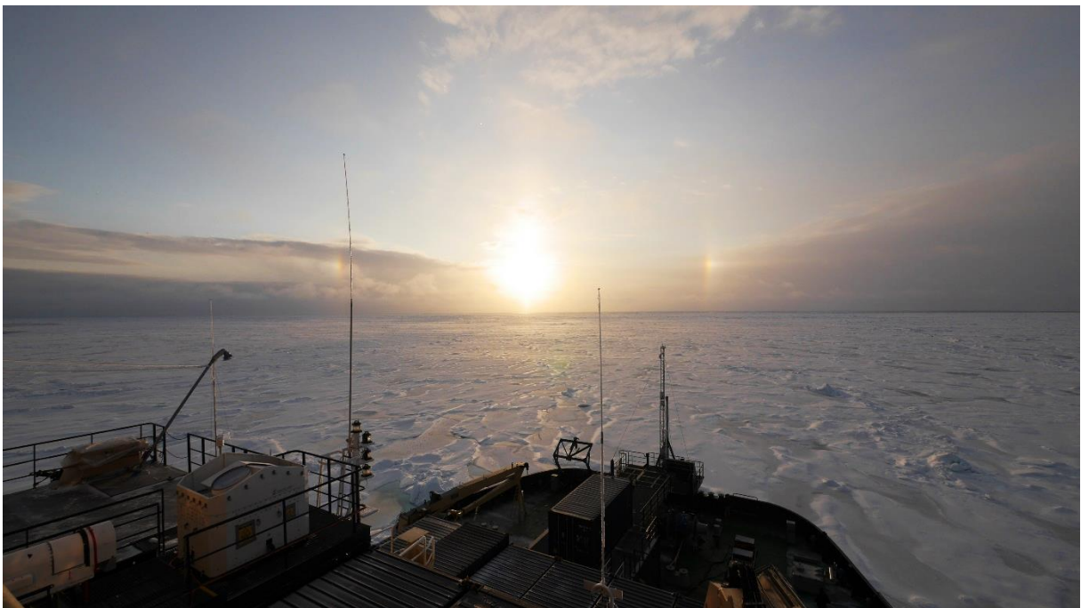
Fin optiskt fenomen med två bisolar med vertikalstolpe genom solen