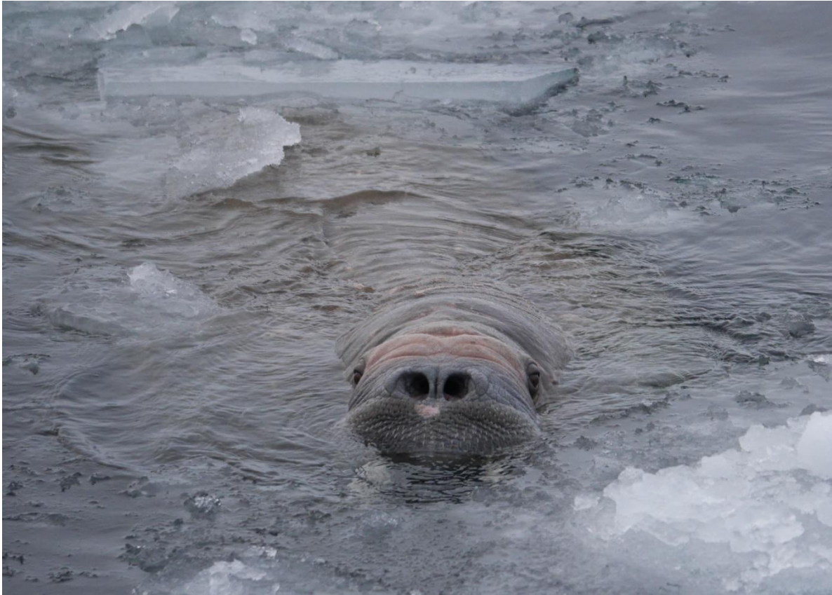
Den såg lit trött och orädd ut trots björnens närvaro.