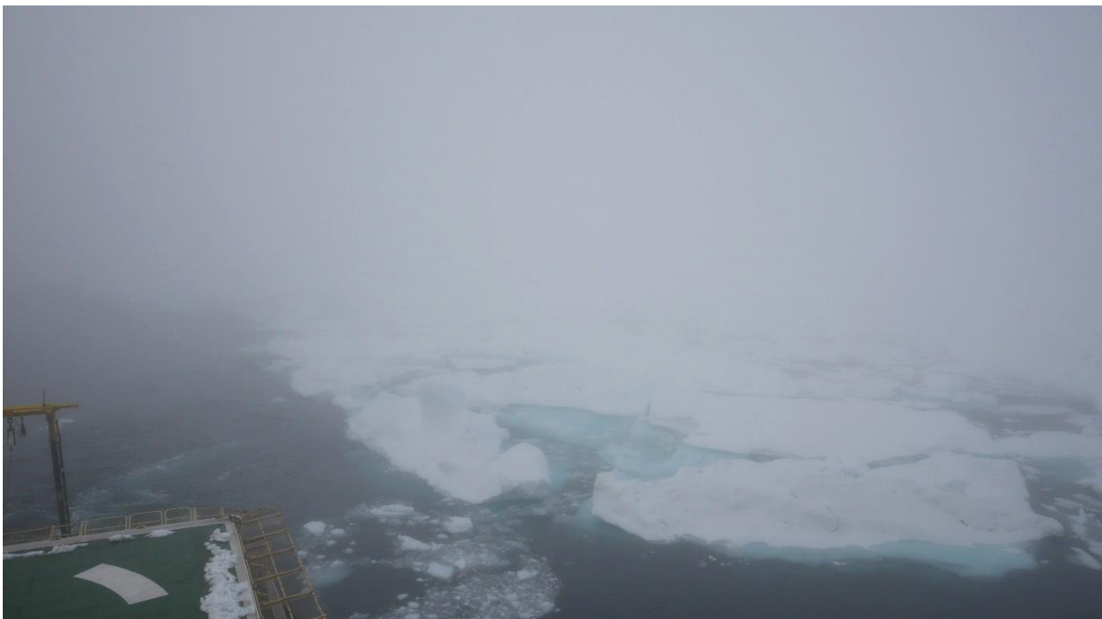
Samma stycke is som förra bilden men med kanske lite bättre perspektiv än förra bilden för att få en aning om hur hög den är.