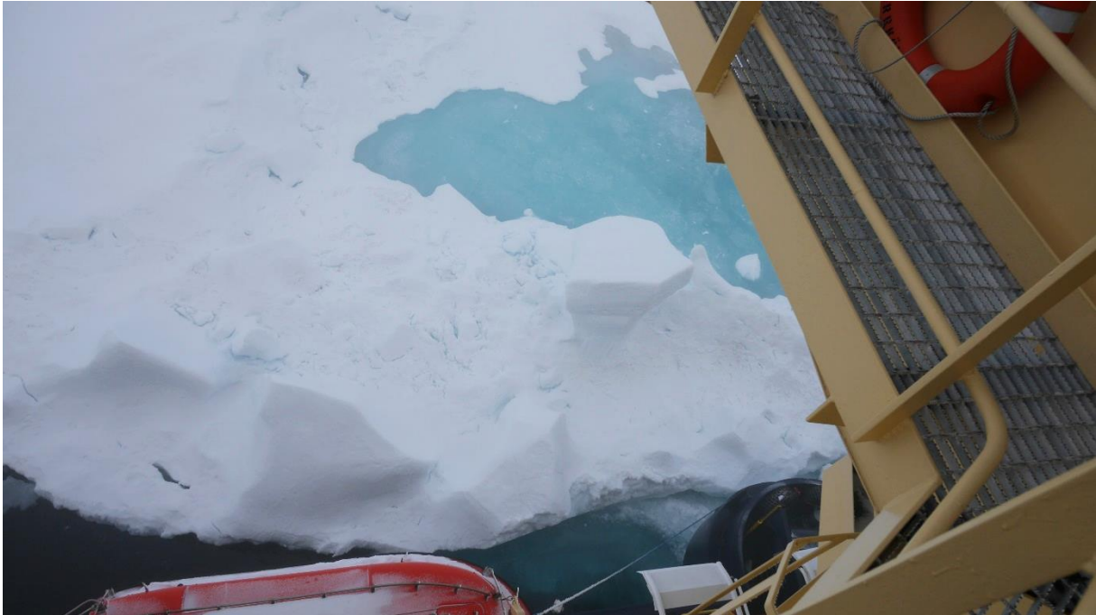
Oden jämte ett stycke före detta landfast flak med formationer högre än fördäcket