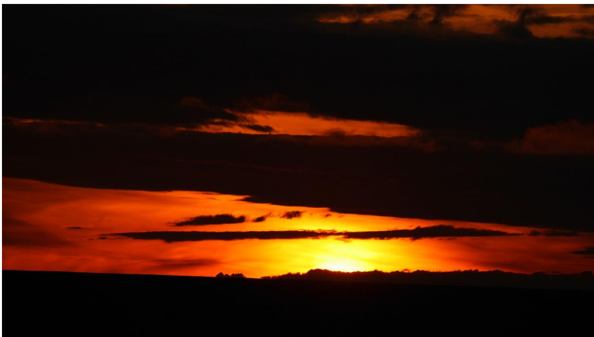
En fin soluppgångsbild i motljus mot Norges kust tagen 2021-09-16