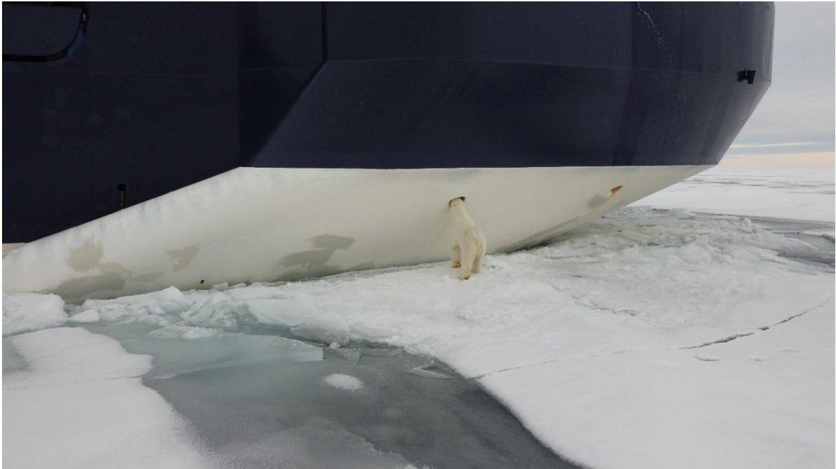
Här fick vi hjälp med att inspektera ventilerna till Odens thrustersystem