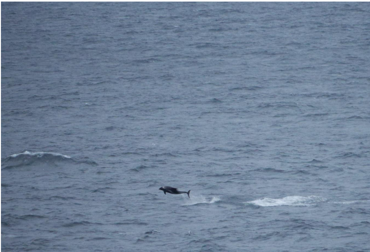
Här har vi en white-beaked dolphin som hoppar glatt vid uppgrundningarna utanför västra Svalbard.