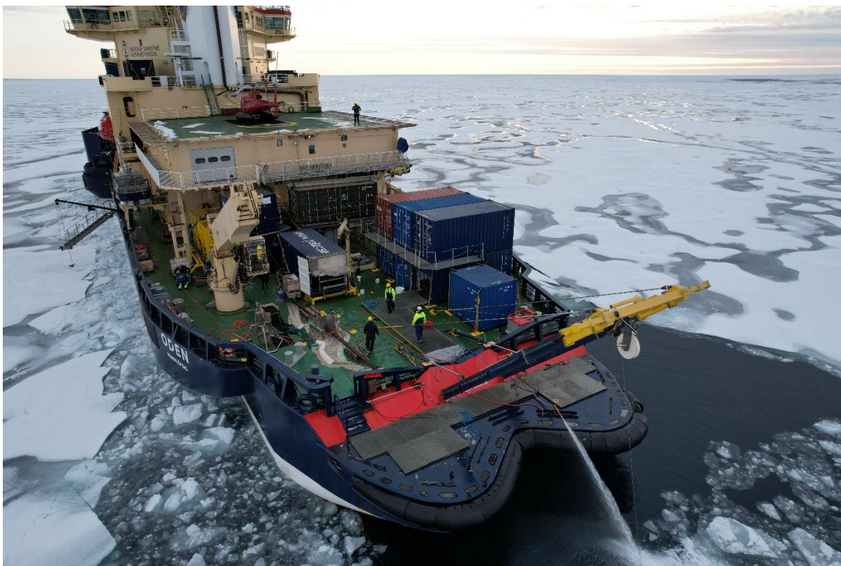
Sista stationen, se den fina strukturen på flerårsflakets yta

Nu arbetar forskarna med sina expeditjonsrapporter, packar, städar ja allt som kan tänkas att behövas innan ankomst till Helsingborg på söndag. På måndag mönstrar forskarna av Oden och lämnar en kuslig tomhet efter sig. Efter att ha varit 75 personer ombord så blir det väldigt tyst och tomt när vi bara blir runt 20 personer kvar. Forskningen avslutades med att vi tog en skopa botten sediment till allas förtjusning. Vi kan också konstatera att fiske i Arktis inte skulle vara en lönsam verksamhet. Vi har fiskat och fiskat och fiskat och lyckats fånga fyra fiskar. Trots denna fiskbrist som expeditionen kommer hem med är det ett mycket viktigt resultat att på Odens rutt genom Arktis fanns det väldigt lite fisk!!