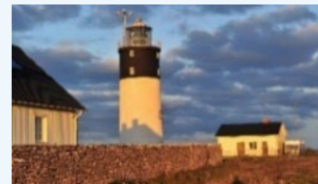
Hoburgs fyr, Burgsvik

Kontakt: Fritidsnämnden, fritidsbostader@sjofartsverket.se telefon 010-478 47 21