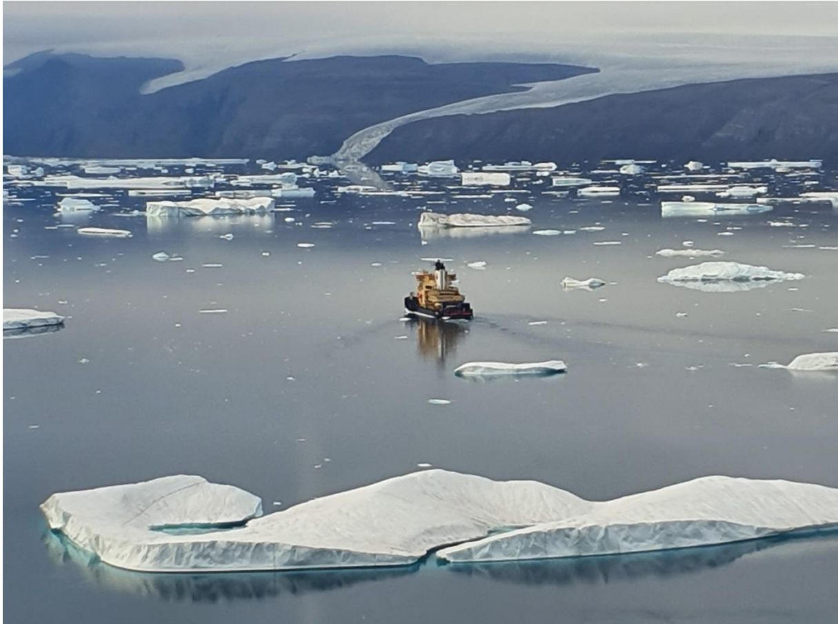
Bild på Oden i Ryder fjorden

Då har vi avverkat andra veckan på Ryderexpeditionen. Det har varit en hektisk vecka med mycket fokus på att hitta väg genom isen mot Ryder fjorden. Vi märker att alla börjar känna sig hemma och komma in i rutiner vad gäller jobb och fritid. Biokvällarna har kommit igång, träningsgrupper har bildats och pingisturneringen är snart igång.